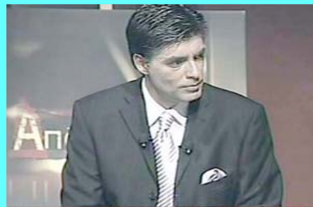
Τηλ. καταγγελιών: 210 68.51.480 - 558 - 563 - 856 ΟΙ ΚΟΜΠΟΓΙΑΝΝΙΤΕΣ ΤΗΣ ΔΙΑΙΤΑΣ