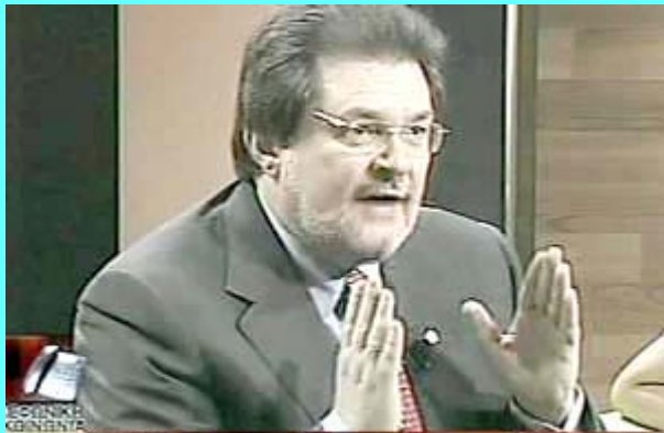
κα ΔΗΜΗΤΡΑ Καταγγέλουσα