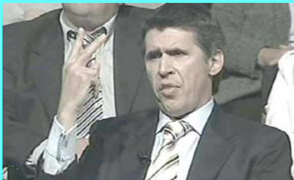
Τηλ. καταγγελιών: 210 68.51.480 - 558 - 563 - 856 ΟΙ ΚΟΜΠΟΓΙΑΝΝΙΤΕΣ ΤΗΣ ΔΙΑΙΤΑΣ