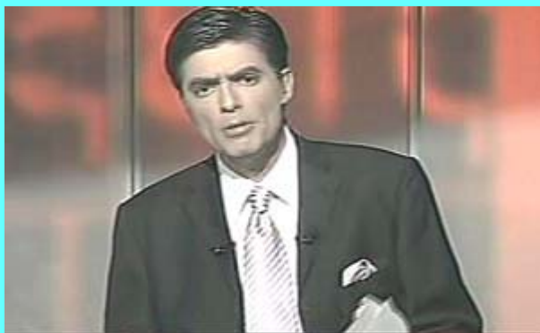
Τηλ. καταγγελιών: 210 68.51.480 - 558 - 563 - 856 ΟΙ ΚΟΜΠΟΓΙΑΝΝΙΤΕΣ ΤΗΣ ΔΙΑΙΤΑΣ