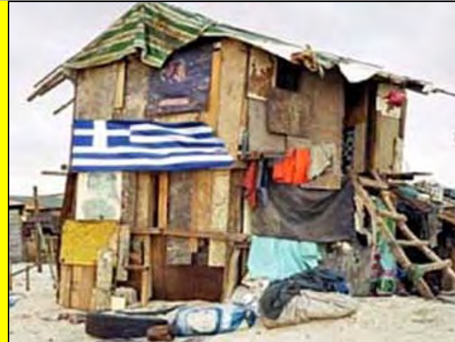
Το ηθικό και αθλητικό ερείπιο, που λέγεται Ελληνική Ομοσπονδία Καράτε, αποκάλυψε τα σάπια του θεμέλια!!!