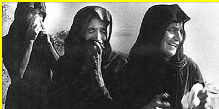
Το γνωστό συγκρότημα των ... Μοιρολογιστρών της Μάνης έγραψε για χάρη του ... "Το Μοιρολόι του Καράτε" ...