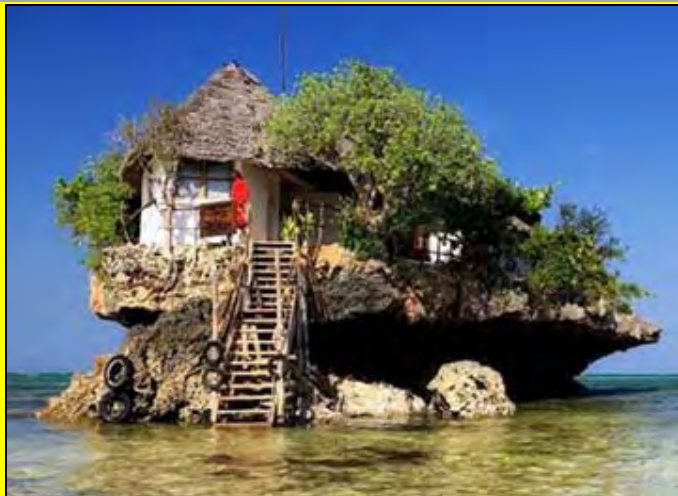
Για άλλη μια φορά απεδείχθησαν τα αποτελέσματα της αδιαφορίας και της γύμνιας της Γενικής Γραμματείας Αθλητισμού, η οποία "εποπτεύει" τον ελληνικό αθλητισμό από τα νησιά ... Πουκέ στην άλλη άκρη του πλανήτη ...