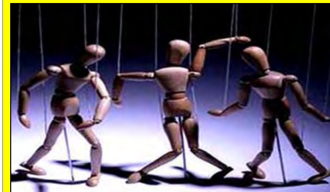
Οι μαριονέτες του Γερόλυμπου στην ΕΛΟΚ πάγωσαν ...