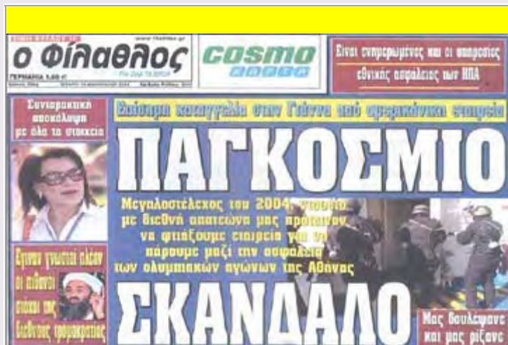
"ΦΙΛΑΘΛΟΣ 18.2.2004" - Επίσημη καταγγελία στη Γιάννα από αμερικάνικη εταιρεία - ΠΑΓΚΟΣΜΙΟ ΣΚΑΝΔΑΛΟ - Μεγαλοστέλεχος του 2004, ντουέτο με διεθνή απάτεωνα μας πρότειναν να φτιάξουμε εταιρεία για να πάρουμε μαζί την ασφάλεια των ολυμπιακών αγώνων της Αθήνας.