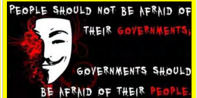
Καλά θα κάνουν αυτοί οι κύριοι να μην ξεχνάνε ότι και τη γραβάτα, και το λαμέ κουστούμι, και το ... σώβρακό τους τα πληρώνει ο ελληνικός λαός για να κάνουν τη δουλειά για την οποία τελικά αποδεικνύονται ΕΠΙΟΡΚΟΙ!!!