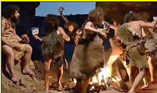
Και ακολουθούσε, όπως συνηθίζεται σε αυτές τις περιπτώσεις, ο εορταστικός ... Χορός της Φωτιάς!!!