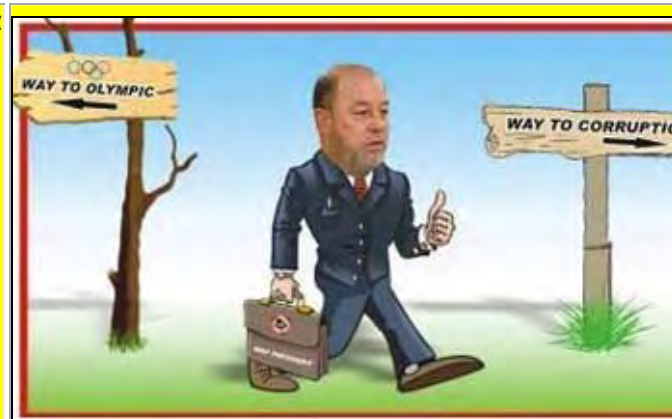
Σκίτσα σαν και αυτό (και τα επόμενα) και κείμενα ακόμα χειρότερα εμφανίζονταν στον ανώνυμο λογαριασμό του Facebook, που όλοι γνώριζαν πως ήταν του Γερόλυμπου και τα βλέπετε με κλικ εδώ!

Η σύγκρουση επήλθε όταν ο Γερόλυμπος κατηγορήσε για διαφθορά και διαπλοκή τον Εσπίνος και τους υπόλοιπους του ΔΣ/WKF από το site του στο Facebook: https://www.facebook.com/wkf.campaign?hc_location=timeline !