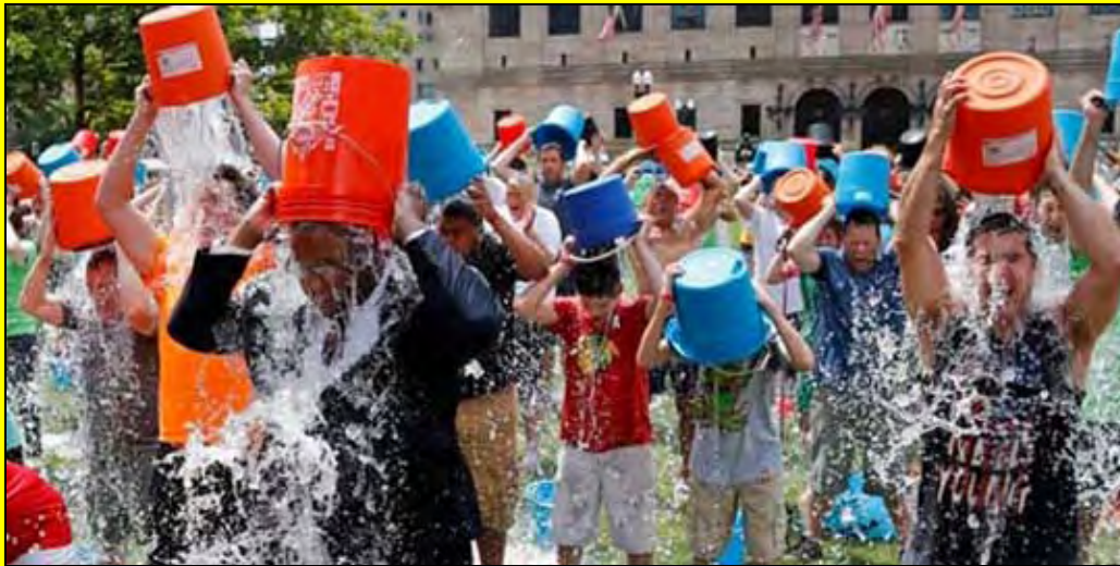
... μετά την απεριγράπτη και παντοτινή πλέον ψυχρολουσία!!!