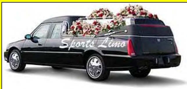
... ενώ επιστρατεύτηκε ειδική Λιμουζίνα για τον Εκλιπόντα!!! Το νέο ταξίδεψε στα πέρατα της γης, ακόμα και εκεί που ο πολιτισμός δεν έχει ακόμα φτάσει!!!