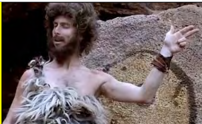
"... Maniaki Gero tubeki, tabuka Karate, tabakata!" (Μετάφραση: "Πήρε ο Γερόλυμπος στις εκλογές του Καράτε!")