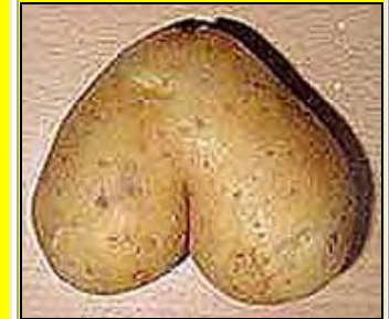
Αυτή δεν είναι αθλητική ομοσπονδία! Αυτή είναι ... πατάτα!!!