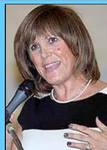
Η γενική γραμματέας Αθλητισμού κα Κυριακή Γιαννακίδου

Καταγγέλλω την Γενική Γραμματεία Αθλητισμού 1) επεικώς για εγκληματική αδιαφορία όσον αφορά στα τεκταινόμενα στην ομοσπονδία του καράτε ΕΛΟΚ, και 2) αυστηρώς για την διαιώνιση του χαρακτηριστικού της Νέας Δημοκρατίας «Συνδρόμου του Γερόλυμπου», που έχει γίνει πλέον «Σήμα Κατατεθέν» της τελευταίας!