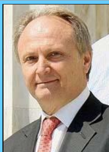
Ο υφυπουργός Αθλητισμού κ. Γιάννης Ανδριανός