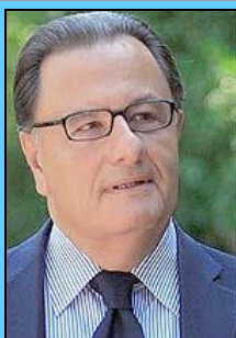
Ο υπουργός Πολιτισμού κ. Πάνος Παναγιωτόπουλος

Το www.karate.gr , σαν συνέχεια του επί 17 χρόνια εκδιδόμενου μηνιαίου αθλητικού περιοδικού " ΔΥΝΑΜΙΚΟ ΤΖΟΥΝΤΟ-ΚΑΡΑΤΕ " (1977-1994), είναι ένας "προσωπικός δημοσιογραφικός ιστότοπος", που γράφεται από τον κορυφαίο γνώστη στον ειδικό χώρο του καράτε , αλλά όχι και επιχειρησιακό Μέσο Μαζικής Ενημέρωσης κατά την έννοια του νόμου 3310/2005. Όσα πρόσωπα κρίνονται εδώ είναι αποδεδειγμένα δημόσια πρόσωπα και κρίνονται για πράξεις και παραλήψεις τους στους τομείς των δημόσιων αρμοδιοτήτων τους υπό τα ευρύτερα όρια κριτικής αξιολόγησης, όπως απαιτεί η διαφύλαξη του δημοσίου συμφέροντος για τον αθλητισμό, τον οποίο χρυσοπληρώνει ο Έλληνας φορολογούμενος!!!