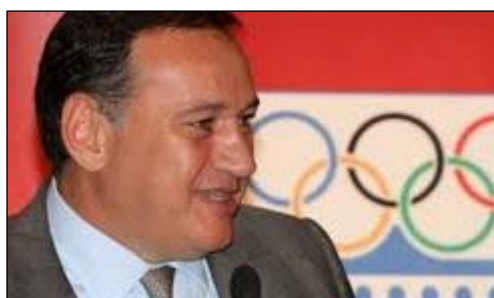
Καπράλος, πρόεδρος ΕΟΕ

SPORT24: Επιμέλεια: Κώστας Χολίδης, Δημοσίευση: 08 Νοε. 2019