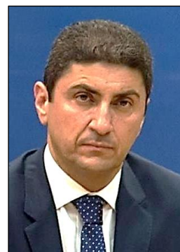
Αυγενάκης, υφυπουργός αθλητισμού

Ταυτόχρονα τον καλούμε να δώσει γρήγορες και αποτελεσματικές λύσεις στα ζητήματα χρηματοδότησης και εγκαταστάσεων ενόψει της Ολυμπιακής χρονιάς, γιατί η Ολυμπιακή προετοιμασία άρχισε και διεξάγεται μέσα σε συνθήκες τελείως κατώτερες από αυτές που η πολιτεία οφείλει να διασφαλίζει».