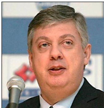
Παναγόπουλος, πρόεδρος ΣΕΓΑΣ

φέρει σύντομα ένα ολοκληρωμένο Νομοσχέδιο για τον Ερασιτεχνικό Αθλητισμό, αφού πρώτα δώσει τη δυνατότητα και το χρόνο για διάλογο και ουσιαστική διαβούλευση.