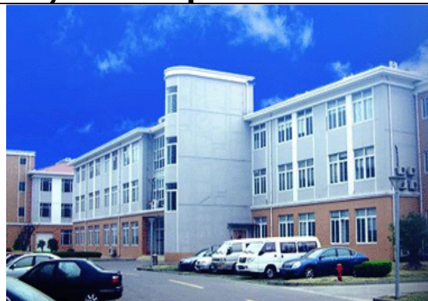
Αριστερά η Βου-Λή και άνω η Σου-Λή! (Αυτούς θα τους εκτελέσουμε τώρα?)

Λόγω της υπόθεσης Κεντέρη-Θάνου-Τζέκου συγκροτήθηκε στις 10/02/05 διακομματική επιτροπή της Βουλής «για τη διαμόρφωση πλαισίου εγγυήσεων διαφάνειας στον αθλητισμό».