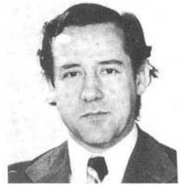
Από τόν Θύμιο Περισίδη