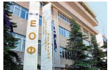
Ο ΕΟΦ εντόπισε 50 φαρμακεία σ' όλη την χώρα που εξήγαγαν παράνομα το αναβολικό ναδρολόνη.

ΣΣ: Ο Γιάννης Σγουρός ήταν αυτός του οποίου η επαγγελματική και πολιτική καριέρα εκτοξεύτηκαν στα ύψη από τις "επιτυχίες" της άρσης βαρών (που με εθνικό δυναμικό 300 αθλητές έπαιρνε παγκόσμια και ολυμπιακά μετάλλια) και ένας από τους Γενικούς Γραμματείς Αθλητισμού που αρνήθηκαν παράνομα, την αναγνώριση της Πανελληνίας Ομοσπονδίας Παραδοσιακού Καράτε παρά τις αποφάσεις Πρωτοδικείου, Εφετείου και Αρείου Πάγου. Από τραπεζικός υπάλληλος βρέθηκε πρόεδρος της Άρσης Βαρών, ΓΓΑ, νομάρχης με το ΠΑΣΟΚ, Γ.Γ. της Παγκόσμιας και πάλι νομάρχης με πάλι το ΠΑΣΟΚ. "Πετάει ο γάιδαρος?"