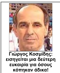
Γιώργος Κοσμίδης: εισηγείται μια δεύτερη ευκαιρία για όσους κόπηκαν άδικα!

Τι άλλο θέλετε για να πειστείτε εκεί στη ΓΓΑ ότι πρόκειται για "Συμμορία Διακεκριμένων Καρα-λαμόγιων"!!! Ο Γενικός Γραμματέας Αθλητισμού οφείλει να επέμβει και να επανορθώσει τις αδικίες!