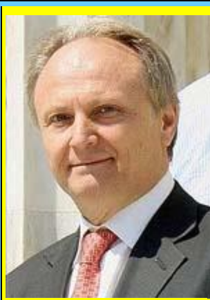
Ο υφυπουργός Αθλητισμού κ. Γιάννης Ανδριανός