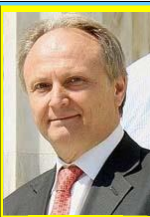
Ο υφυπουργός Αθλητισμού κ. Γιάννης Ανδριανός