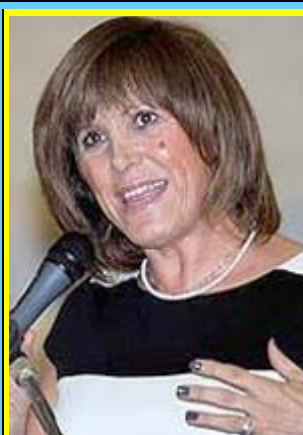
Η γενική γραμματέας Αθλητισμού κα Κυριακή Γιαννακίδου