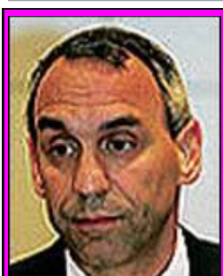
13-Γερόλυμπος "ΕΠΙΤΙΜΟΣ" "Ο ΑΡΧΙΤΕΚΤΩΝ"

προπονητή της ΓΓΑ, διότι πέρασε από την Σχολή Προπονητών, στην οποία εγώ ήμουν διευθυντής και το έχω υπογράψει!!!), παραβιάζει και την αθλητική νομοθεσία, αφού εμφανίστηκε ως αντιπρόσωπος συλλόγου.