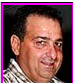
14-Σκοπελίτης Ιδιοκτήτης "Sportdata"