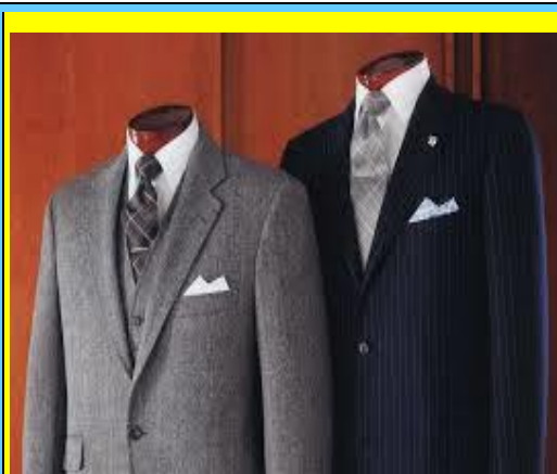
Άδεια κουστούμια διοικούν τον αθλητισμό της χώρας!!!

Προς την ΓΓΑ: Δύο αμαρτωλές Θητείες του ΔΣ της ΕΛΟΚ επιχορηγείτε με χρήματα του Ελληνικού Λαού χωρίς έλεγχο! Είστε Άχρηστοι στον Ελληνικό Λαό! Κλείστε το!!!