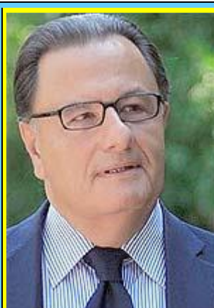
Ο υπουργός Πολιτισμού κ. Πάνος Παναγιωτόπουλος

Το www.karate.gr , σαν συνέχεια του επί 17 χρόνια εκδιδόμενου μηνιαίου αθλητικού περιοδικού " ΔΥΝΑΜΙΚΟ ΤΖΟΥΝΤΟ-ΚΑΡΑΤΕ " (1977-1994), είναι ένας "προσωπικός δημοσιογραφικός ιστότοπος", που γράφεται από τον κορυφαίο γνώστη στον ειδικό χώρο του καράτε , αλλά όχι και επιχειρησιακό Μέσο Μαζικής Ενημέρωσης κατά την έννοια του νόμου 3310/2005. Όσα πρόσωπα κρίνονται εδώ είναι αποδεδειγμένα δημόσια πρόσωπα και κρίνονται για πράξεις και παραλήψεις τους στους τομείς των δημόσιων αρμοδιοτήτων τους υπό τα ευρύτερα όρια κριτικής αξιολόγησης, όπως απαιτεί η διαφύλαξη του δημοσίου συμφέροντος για τον αθλητισμό, τον οποίο χρυσοπληρώνει ο Έλληνας φορολογούμενος!!!