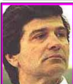
11-Πάσης ... Σουπιά!

Επί πλέον των ανωτέρω, ο Κοσμίδης συμμετέχει δια της γνώσεως και της ανοχής του σε κάθε διοικητική και οικονομική παρανομία που διαπράττει κάθε άλλο μέλος του ΔΣ/ΕΛΟΚ!