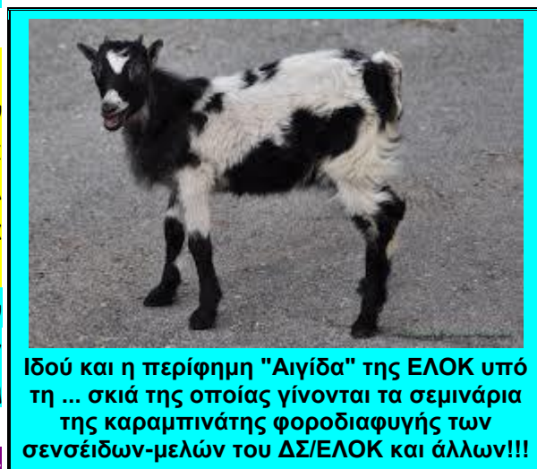
Ιδού και η περίφημη "Αιγίδα" της ΕΛΟΚ υπό τη ... σκιά της οποίας γίνονται τα σεμινάρια της καραμπινάτης φοροδιαφυγής των σεנסείδων-μελών του ΔΣ/ΕΛΟΚ και άλλων!!!

Δεν υπάρχει λογισμικό στον κόσμο, το οποίο μεταξύ των επιλογών του να μην έχει και επιλογές «κατά τις επιθυμίες του χρήστη» (απλούστατα, διότι τότε δεν θα το αγόραζε κανείς), πράγμα που σημαίνει ότι οι κληρώσεις μπορούν άνετα να μην είναι «τυχαίες» όπως σας λένε, αλλά έχουν τη δυνατότητα να μαγειρεύονται με ό,τι αυτό μπορεί να σημαίνει: από απλή αισχρή κλοπή της νίκης από