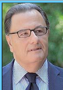
Ο υπουργός Πολιτισμού κ. Πάνος Παναγιωτόπουλος