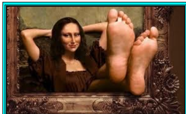
Καλή η Τζιοκόντα (ΓΓΑ!) στο ... Μουσείο της Διακυβέρνησης, αλλά αν ... βρωμάνε τα πόδια της ποιος τη βάζει στο σπίτι του?

δ) Έτσι, η ΕΛΟΚ μετατρέπεται σε μαγαζί του Γερόλυμπου χωρίς κανένα έλεγχο! Τόσο άχρηστοι είσαστε εσείς της ΓΓΑ!