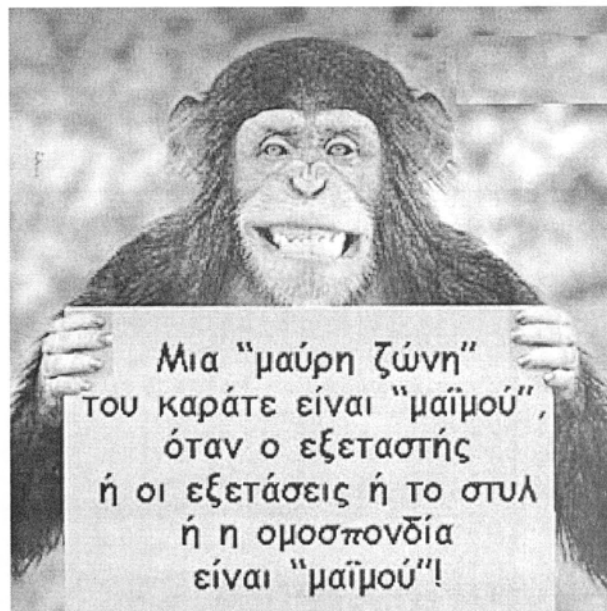
Μας πήρανε χαμπάρι ακόμα και ... οι Μαϊμούδες!

7 - τα αποτελέσματα αυτών των εξετάσεων έχουν επικυρωθεί από το ΔΣ της ΠΟΠΚ και άρα οι νέοι βαθμοφόροι είναι καταγεγραμμένοι στο Μητρώο Μαύρων Ζωνών της ΠΟΠΚ.