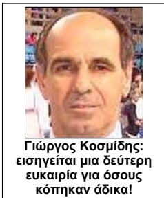
Γιώργος Κοσμίδης: εισηγείται μια δεύτερη ευκαιρία για όσους κόπηκαν άδικα!

Τι άλλο θέλετε για να πειστείτε εκεί στη ΓΓΑ ότι πρόκειται για "Συμμορία Διακεκριμένων Καρα-λαμόγιων"!!! Ο Γενικός Γραμματέας Αθλητισμού οφείλει να επέμβει και να επανορθώσει τις αδικίες!