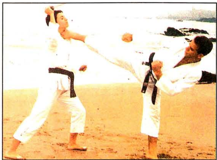
Ο Γάλλος εκπαιδευτής κ. Λορέντ, σε τεχνική αυτοάμυνας με αθλήτριά του.

ΑΠΟ 19-21 ΟΚΤΩΒΡΙΟΥ 1994 ΣΤΟ ΟΛΥΜΠΙΑΚΟ ΑΘΛΗΤΙΚΟ ΚΕΝΤΡΟ ΑΘΗΝΩΝ «ΣΠΥΡΟΣ ΛΟΥΗΣ»