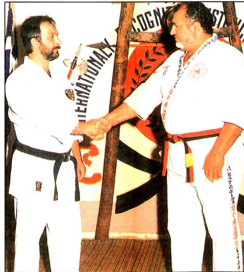
Οι δύο αρχηγοί του Οκινάουα Τε και Σίτο - Ριού δίνουν τα χέρια επικυρώνοντας τη μελλοντική συνεργασία των δύο συστημάτων.