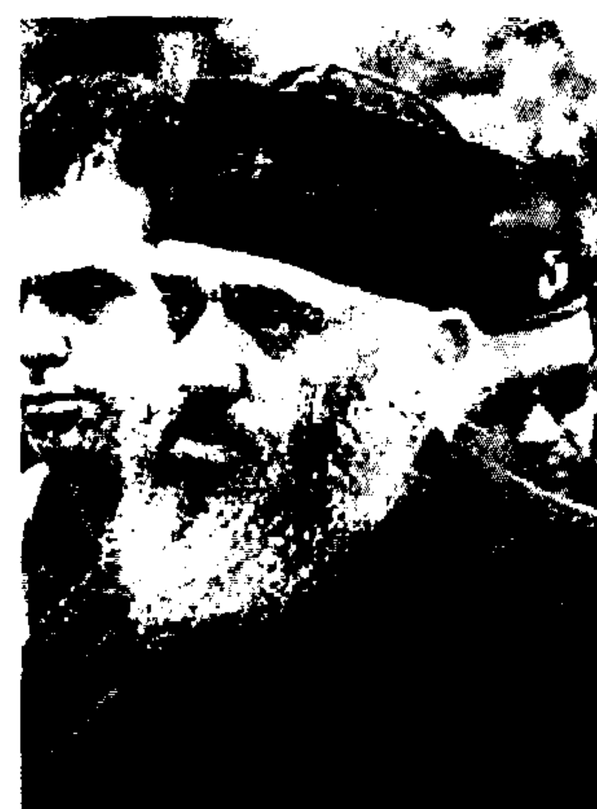
Από το πλήθος των κατηγοριών έμεινε μόνο μια πλαστή ταυτότητα

Πρόκειται, ειδικότερα, για έκδοση πλαστής ταυτότητας την οποία χρησιμοποίησε για να εκδώσει πλαστό διαβατήριο με το όνομα Αντώνιος Ιωσήφ Αϊβαλιώτης, ενώ επίσης κατά την κατηγορία «Βαβύλης και Τριανταφυλλάκης τον Σεπτέμβριο του 2003 συνέταξαν επιστολή που δήθεν είχε γραφτεί στην Αγία Πόλη των Ιεροσολύμων με αποστολέα τον Ειρηναίο και παραλήπτη τον Γιάσερ Αραφάτ. Με αυτήν αμφοτέροι